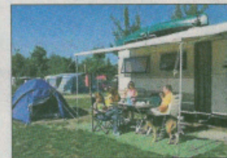
Im Umweltschutz vorn: die Haveltourist GmbH Groß Quassow