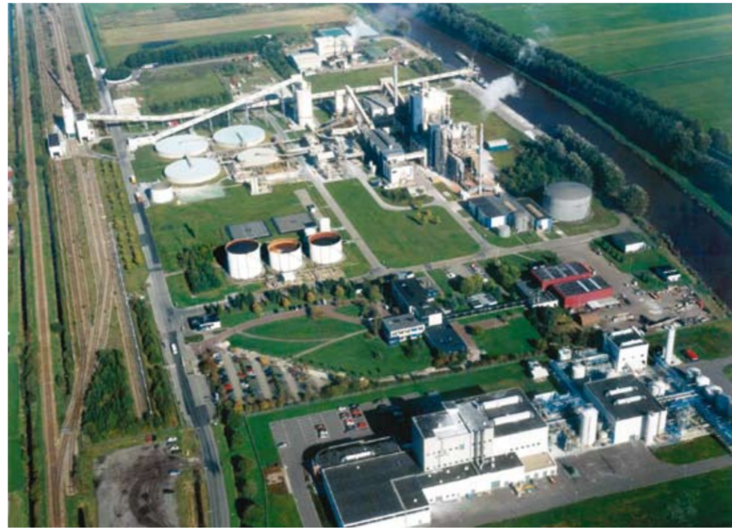
Abb. 1: Luftaufnahme des Werkes von Nedmag Industries in Veendam, Niederlande.