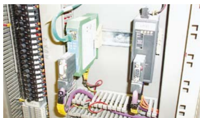
Abb. 3: Das Ethernet-Profibus-Interface xEPI (grünes Bauteil) ermöglicht die einfache Anbindung von Profibus-Netzen an das Ethernet. Es unterstützt eine umfangreiche Anzahl von internationalen offenen Standards auf einer Hardwareplattform. Dazu gehören FDT, EDD, OPC und Profinet. Mit dem Gateway können herstellerunabhängige Lösungen und flexible Konzepte zur durchgängigen vertikalen Integration von Produktionsprozessen realisiert werden.

Neben der Bedienfreundlichkeit, spielten für Nedmag noch andere